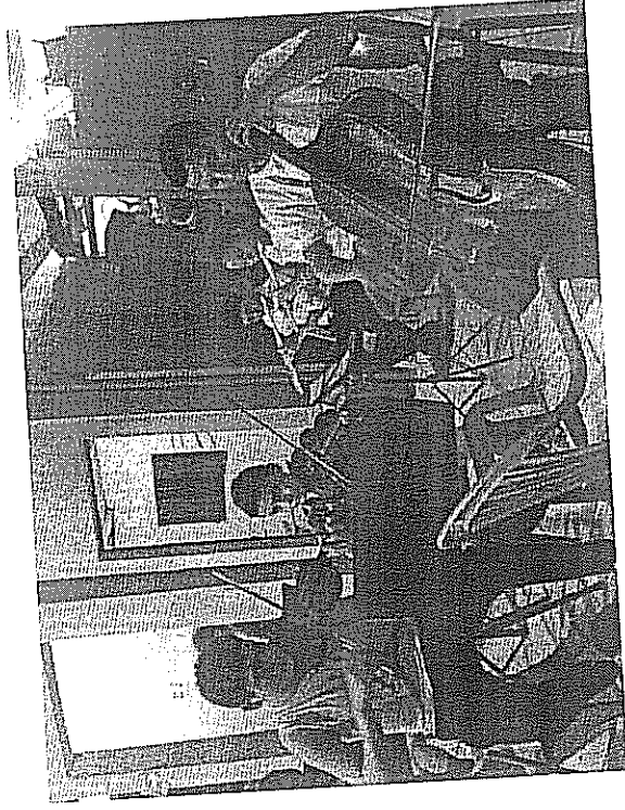
Afinación y empaste orquestal fase I Actividad realizada el 17 de octubre de 2018